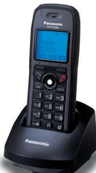
KX-TCA355 Model wzmocniony