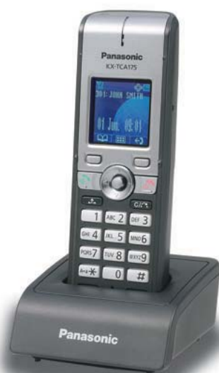
KX-TCA175 Model standardowy