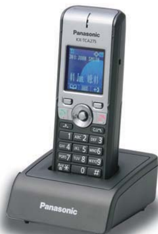
KX-TCA275 Kompaktowy model biznesowy